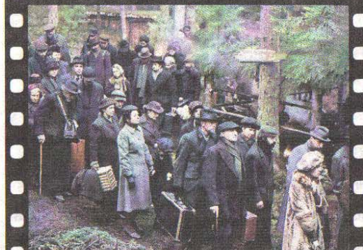
Conflictos. Las divisiones que se abren en el grupo amenazan su supervivencia