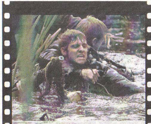
Valientes. Los rumores sobre el coraje de los hermanos se extiende entre los huidos

La crisis, en el caso de la película, pone también de manifiesto la necesidad de un liderazgo fuerte. Resulta ilustrativo el esfuerzo de los prófugos por constituir una auténtica comunidad, en la que todos arman el hombro, y en la que se reconoce la autoridad de quién marca el rumbo.