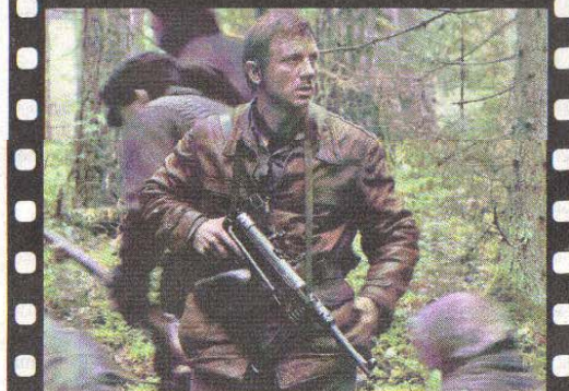
Cuestionado. El líder de los perseguidos se muestra a veces dubitativo